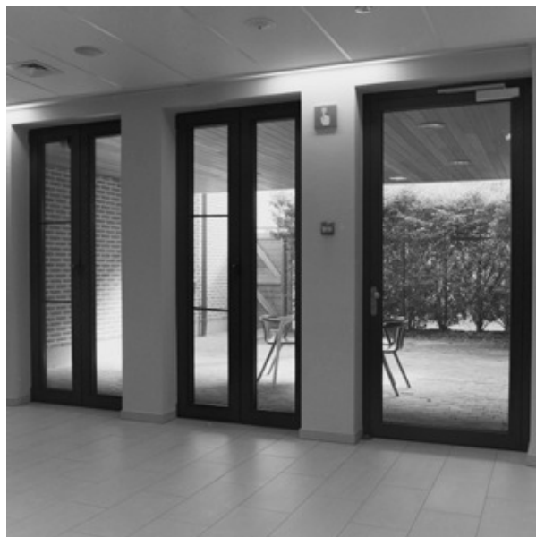
De prikkelarme kamer in de opnameafdeling Sint-Jan (SAD) heeft een eigen terras

Uitwerking van een bijdrage aan het vijfde atelier van de Atelierreeks Take Care! , een initiatief van o.a. De Stadsacademie op 19 januari 2021.