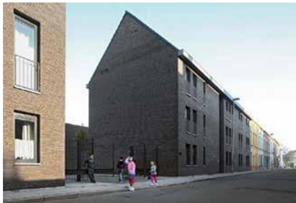
PVT De Lorkenstraat sluit aan op het omliggende stratenpatroon

Het geval PVT De Lorkenstraat toont het belang van relationele architectuur. Het PVT werd gebouwd op de grens van het psychiatrisch centrum Dr. Guislain in Gent in de vorm van een straat die aansluit op de buurt. Na verloop van tijd werd een hek geplaatst dat de quasi publieke straat terug afsloot. Kinderen uit de buurt gebruikten het PVT net iets te graag als speelplek, wat voor conflicten zorgde met bewoners. Inclusie is een goede zaak, maar het is niet de bedoeling dat het PVT als pasmunt dient voor een gebrek aan verkeersluwe straten in de woonwijk. ( Psyche 24/1 )