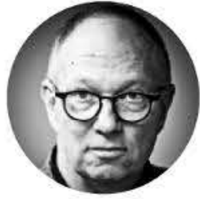
Ian Buruma Historicus en schrijver van onder meer Het Churchill-complex (Atlas Contact).

RADICAAL-RECHTS Het succes van radicaal-rechts kent verschillende oorzaken. Maar wat er altijd onder zit, is het misnoegen van de aanhangers, het gevoel niet gehoord te worden, schrijft Ian Buruma.