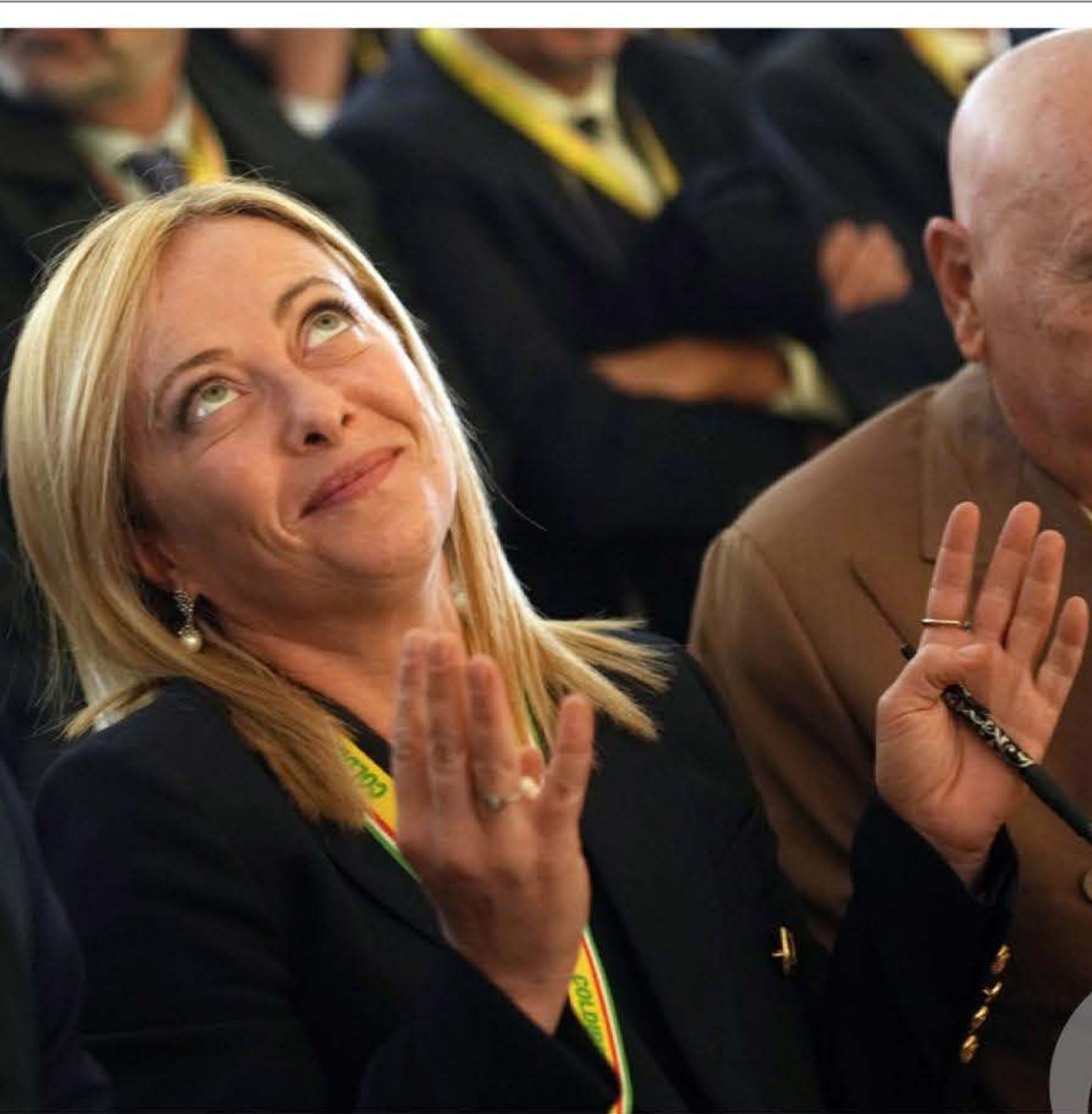
het gevoel van verongelijkheid onder de Italianen.

Frankrijk, en ook Nederland, voelt het platteland zich achtergesteld.