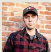
Cis Dewaele Vlaams Straathoekwerk Overleg

Als de rellen in Meulenberg iets leerden, dan is het dat de aanwezigheid van uniformen niet altijd de gemoederen bedaar. Zonder risico op plunderingen of vernielingen kan de politie zich beter low profile houden? Moet zij het afkoelen van heethoofden overlaten aan straathoekwerkers?