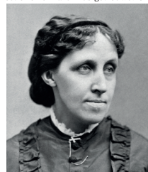
'Oude vrijster' Louisa May Alcott.

ten blijven'. Maar ze voelde zich zo onder druk gezet dat ze niet durfde te weigeren, en koos 'uit perversiteit een eigenaardige partij voor haar'. Aan het einde van deel twee is effectief elke March-zus getrouwd. Of