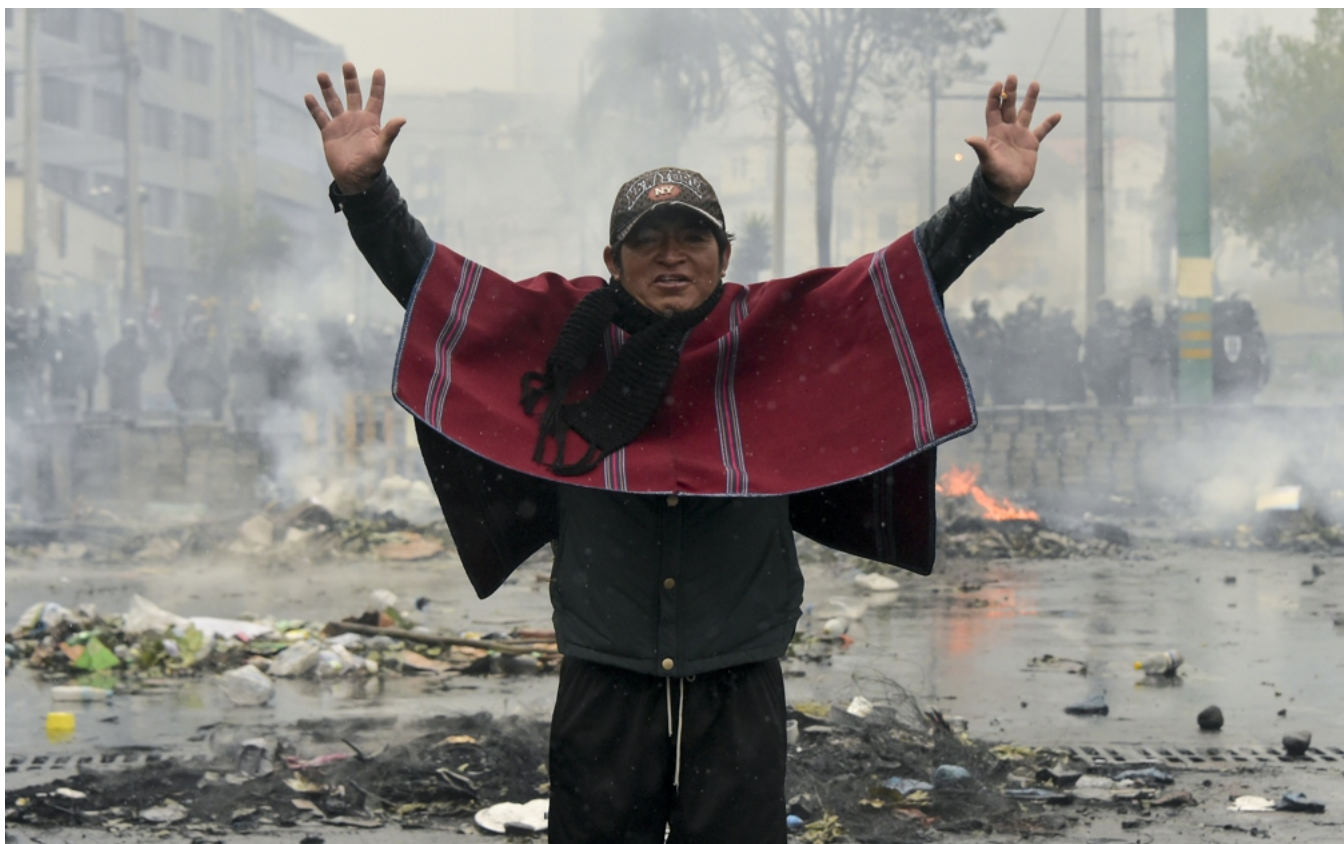
In Ecuador betoogde de bevolking van inheemse afkomst tegen de afschaffing van de brandstofsubsidies.