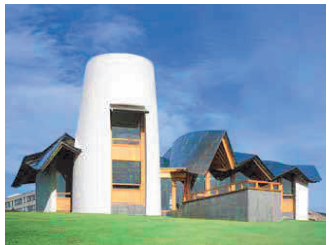
Maggie's Dundee, ontwerp: Frank O. Gehry