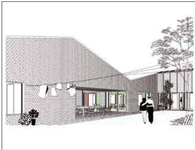
Voorstel 3 (RAUM)

om. Het zorgpension staat aan de straat, centraal op de kavel, met de polyvalente ruimtes op de benedenverdieping. Het verzorgingstehuis en kinderdagverblijf liggen centraal en zelfs verzonken in de groene omgeving. De assistentiewoningen sluiten aan op de woonwijk achter. De gebouwen liggen als stapstenen op de site. Hun onderlinge verschuiving bakent diverse buitenruimten af met elke een eigen sfeer: een dierenweide, een moestuin, een speeltuin en twee huistuinten. Aan de straat wordt een parking voorzien. Ook de bestaande gebouwen van het zorgcentrum krijgen huistuinten. De verschillende gebouwen en buitenruimten worden met elkaar verbonden door een netwerk van groene paden die het hele gebied doorkruist.