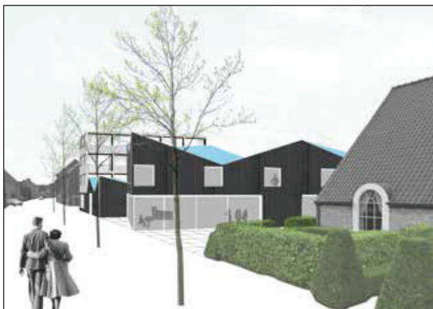
Voorstel 5 (NU Architectuuratelier)

onderzoeker Bavo / Faculteit Architectuur KU Leuven