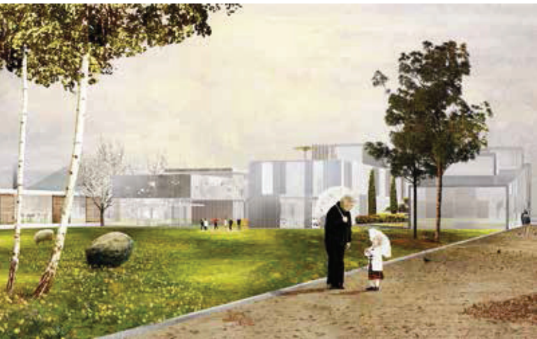
Voorstel 2 (Schmitz/Igodt)

De autonomie van elk huis wordt benadrukt door een diverse vormgeving en dito materialisatie. Enkele luifels en passerellen verbinden de vier gebouwen en maken interne circulatie mogelijk. De woonvolumes sluiten aan op de rijwoningen in de dorpsstraat. Het zorgcentrum is hiermee zichtbaar aanwezig op het dorpsplein. Elk huis krijgt alle elementen die een traditionele woning kenmerkt, zoals stoep, voortuin en achtertuin. De groene ruimte achterin het perceel presenteert zich als een akker die de bestaande en nieuwe infrastructuur met elkaar verbindt. Het straatprofiel schermt de groene ruimte af van het dorpsplein.